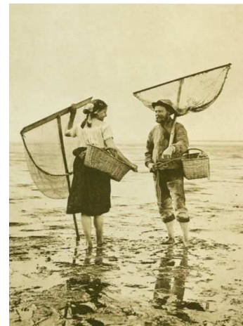
Abb. 1: Krabbenfischer im Watt (um 1895)

Das „Büttpedden“ oder „-grabbeln“ in den Sielen, Prielen und im Wattenmeer erfolgte ohne besondere Hilfsmittel: „Wenn die Flut zurückging und der Butt (Scholle) sich im Schlick verkrochen hatte [...] wurde er mit den Füßen aufgeschreckt und man musste ihn festhalten, damit er nicht wieder entschlüpfte.“ Auch für das Krabben-/ Garnelenfischen waren keine Boote, sondern nur ein Netz („Glüpp“/ „Gliep“) erforderlich. Miesmuscheln wurden zunächst nur vom trocken fallenden Wattboden aufgesammelt, bevor Ende des 19. Jahrhunderts neue, tideunabhängige Fangmethoden z.B. mit Schleppnetzen entwickelt wurden.